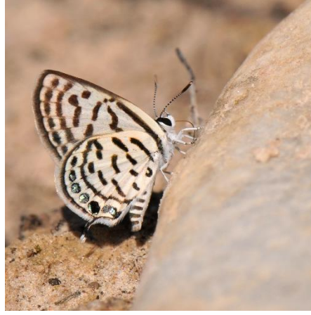
Klein christusdoorn- blauwtje Griekenland