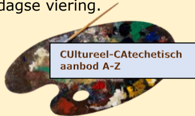
Cultureel-Catechetisch aanbod A-Z

We hopen van harte dat u erbij bent bij één van deze twee bijeenkomsten! Het dialoogdocument kunt u vinden op de website van de parochie of op de tafel achter in de kerk. Op 9 maart praten wij daar ook over in het geloofsgesprek na de zondagse viering.